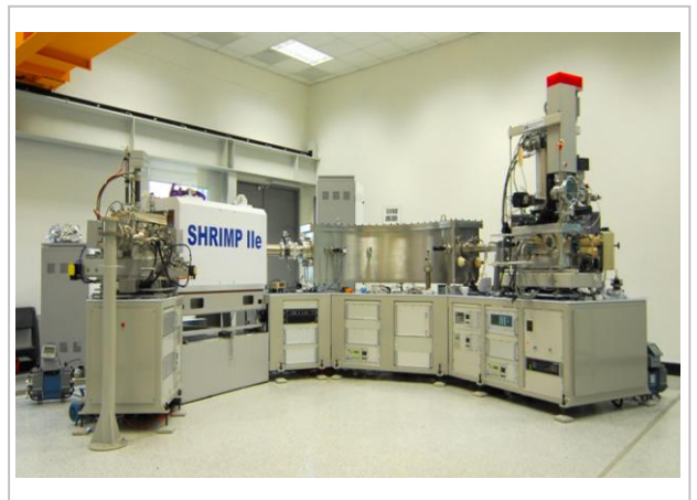
[그림2] KBSI 선도장비인 초고분해능 이차이온 질량분석기 (SHRIMP)